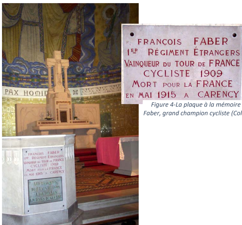
Figure 4-La plaque à la mémoire de François Faber, grand champion cycliste