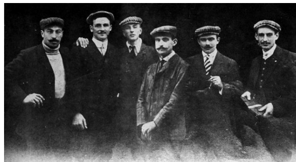
Figure 5 - François Faber "en civil" en compagnie d'autres coureurs du Tour de France. De gauche à droite : Van Houwaert, Faber, Alavoine, Garrigou, Trousselier et Duboc.