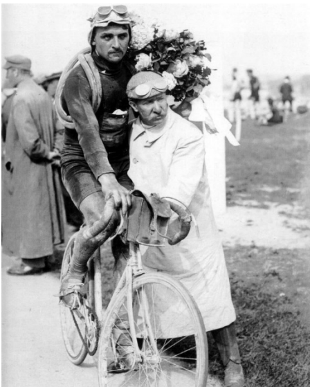
Figure 2-François Faber à l'arrivée de Paris - Roubaix

La presse titre alors « Faber est trop fort. Il gagne six étapes dont cinq successivement ! ». Il est également le premier à avoir réalisé cet exploit. Rappelons que ce Tour fut l'un des plus froids de l'histoire si ce n'est le plus froid. 1909 sera d'ailleurs sa grande année puisqu'il gagnera cette année-là trois autres grandes classiques en France et en Belgique. En 1910, Faber est second derrière Octave Lapize après avoir remporté trois étapes, une seconde place et deux troisièmes places. Il aura crevé deux fois sur la même étape. Il gagne le Paris – Tours.